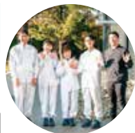
株式会社 コスモス食品

フリーズドライのスープ・おみそ汁が繋ぐ“ご縁”を大切に、「ワクワクであふれる場を繋げていきたい」とイベントの企画運営をおこなっています。