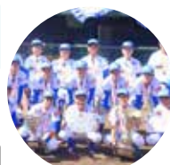
兵庫ブルーサンダーズ