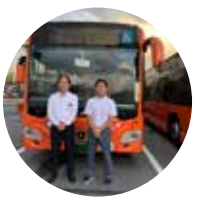
神姫バス株式会社 三田営業所