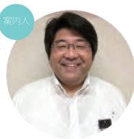
神姫バス株式会社 三田営業所 首席運行助役

予約問合せ sb-sanda@shinkibus.co.jp 予約締切 11月17日(水)