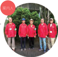
一般社団法人三田市観光協会 さんだ観光ガイド

11/7(日)・20(土)・26(金) 9:30~13:30 集合時間:15分前