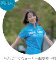
たんばエヌウォーカー倶楽部 代表 日本ノルディックウォーキング協会 上級インストラクター

集合場所: 千刈カンツリー倶楽部 (三田市山田大道ケ平605) 参加料金: 3,700円 ※ランチ・ドリンク付き 定員: 20人(最少催行人数:10人)