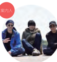
一般社団法人 イヒ (いひ)

集合場所: 三田市総合案内所 (三田市駅前町1-31 三田駅前キッピースクエア) 参加料金: 1,000円 定員: 5人(最少催行人数:3人)